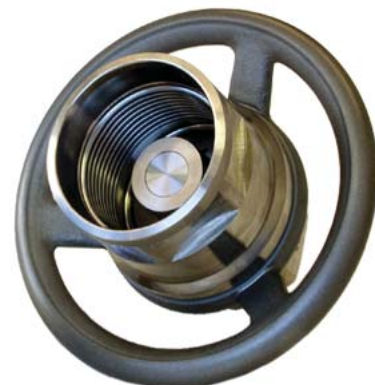
БРС для высокого давления серии HP High pressure couplings series HP