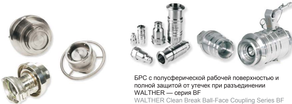
БРС с полусферической рабочей поверхностью и полной защитой от утечек при разъединении WALTHER — серия BF WALTHER Clean Break Ball-Face Coupling Series BF

Другие БРС с полной защитой от утечек при разъединении производства WALTHER-PRÄZISION для химических веществ: More clean break couplings of WALTHER-PRÄZISION in chemical applications: