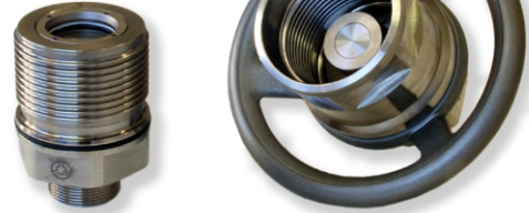
Schraubkupplungen der Serie CH Screw type couplings series CH

Für jede Anwendung die richtige Kupplung. Mehr als 400.000 weitere Varianten für alle Industriebereiche! For each application the best suitable coupling. More than 400,000 other variations for all industrial areas!