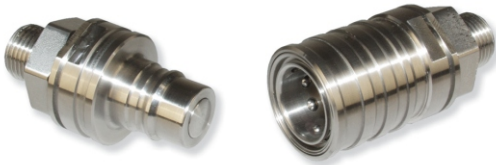
Hochdruck-Kupplungen der Serie CP High pressure couplings series CP