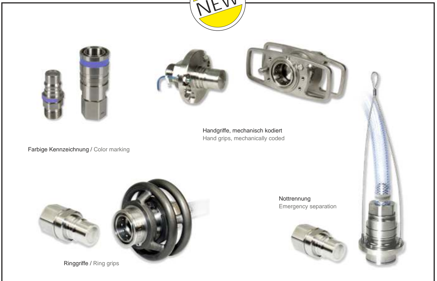
Farbige Kennzeichnung / Color marking