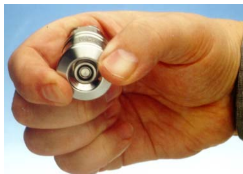
Verriegelungshülse zurückgeschoben (in Reinigungsposition)

Zum Zurückbringen der Verriegelungshülse in die Reinigungsstellung ist ein Kraftanschlag (Rastpunkt) zu überwinden. Insbesondere bei den größeren Nennweiten geschieht dies vorteilhaft durch einen leichten Schlag mit der flachen Hand auf die Stirnfläche der Kupplung bzw. Verriegelungshülse.