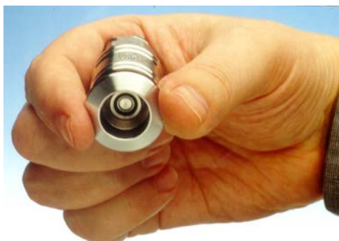
Verriegelungshülse in Normalposition vorn (in Kuppelbereitschaft)

Zwecks Abwischen der ball face Stirnkontur der Kupplung, lässt sich die Verriegelungshülse der Kupplung in eine zurückverlagerte Reinigungsstellung bringen (siehe Bilder)